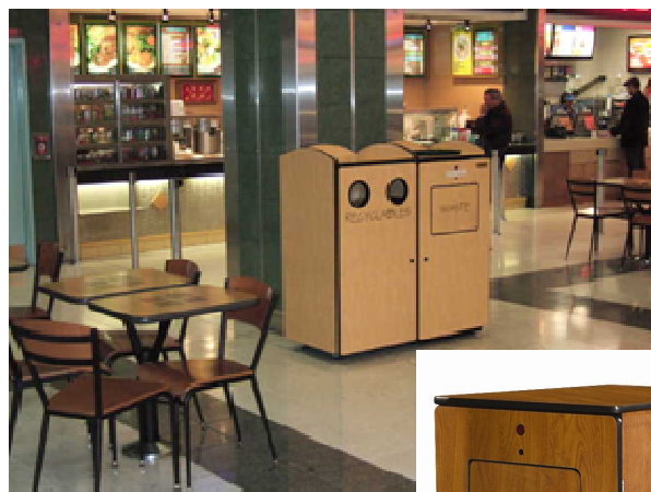
Another great idea from Harmony Enterprises Inc*

Harmony Enterprises, l'assurance de produits de qualité à des prix abordables.