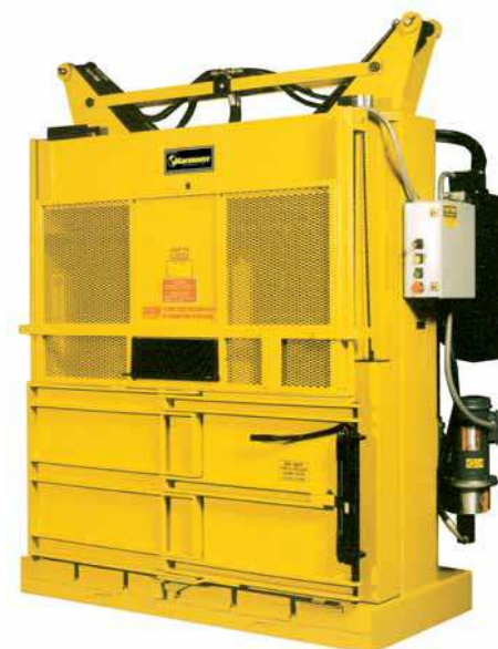
Another great idea from Harmony Enterprises Inc*

Harmony Enterprises, l'assurance de produits de qualité à des prix abordables.