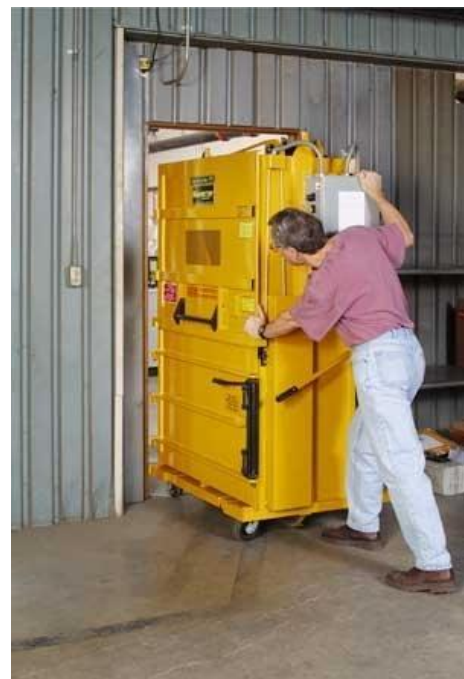
Another great idea from Harmony Enterprises Inc*

Harmony Enterprises, l'assurance de produits de qualité à des prix abordables.