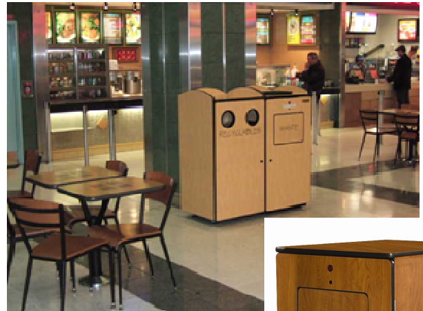
Another great idea from Harmony Enterprises Inc*

Harmony Enterprises, l'assurance de produits de qualité à des prix abordables.