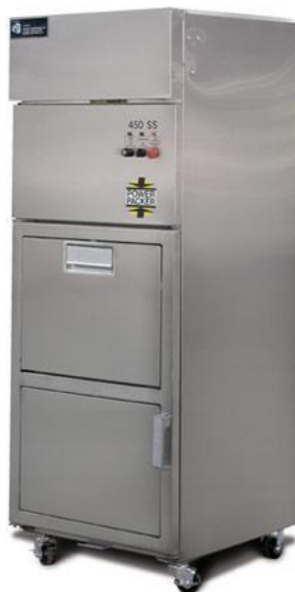
Another great idea from Harmony Enterprises Inc*

La presse Power Packer est la solution parfaitement adaptée au compactage des déchets alimentaires et mélangés. Elle s'installe à proximité immédiate de la source de déchets.