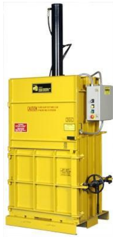
Another great idea from Harmony Enterprises Inc*

Harmony Enterprises, l'assurance de produits de qualité à des prix abordables.